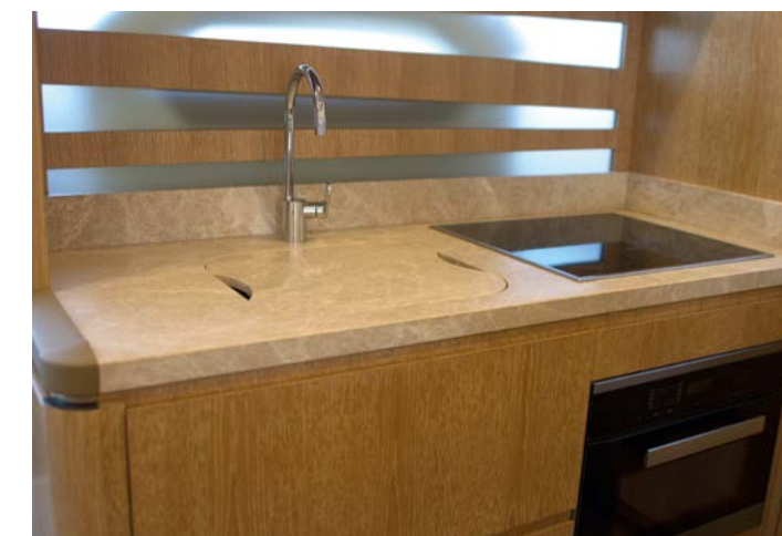
Весь камбуз, включая расположение, конфигурацию и начинку шкафов, был переделан согласно пожеланиям владельца.