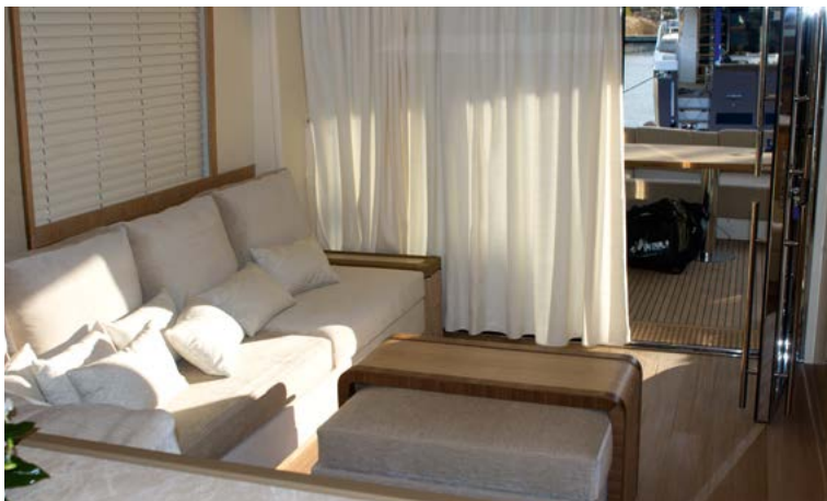
Справа: Обеденная зона одновременно компактна и функциональна — во время трапез стол раскладывается.