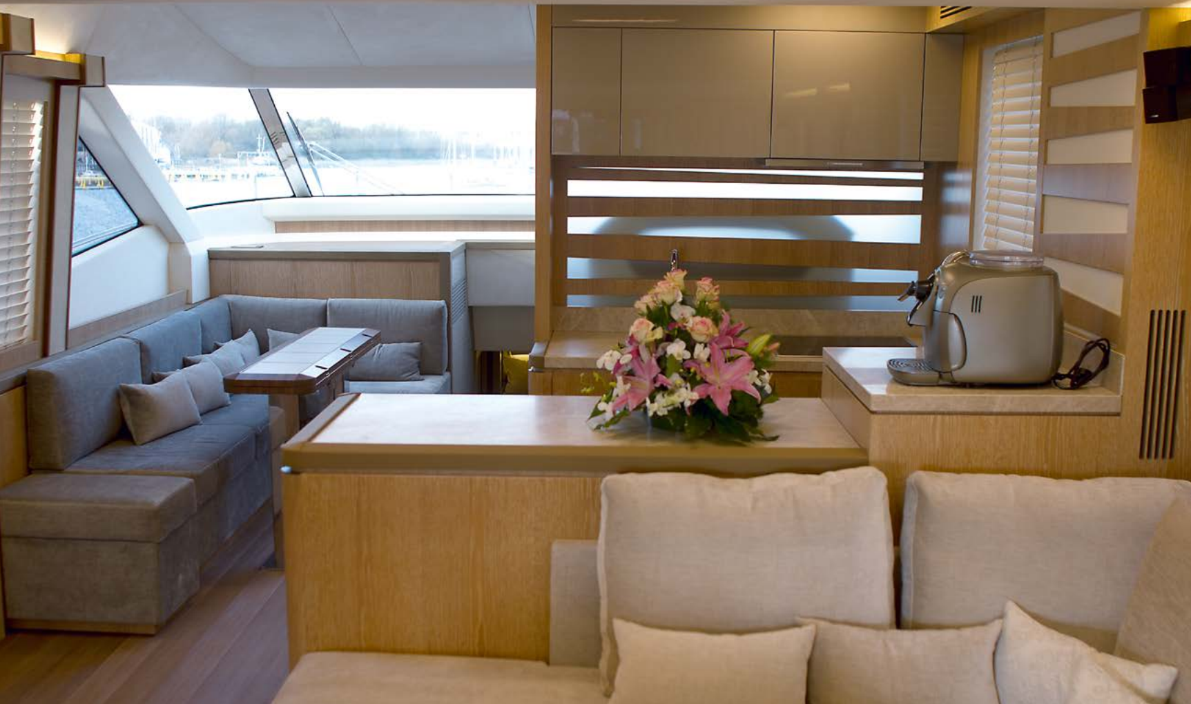
Открытый камбуз визуально увеличивает пространство, а на месте большого холодильника красуется кофемашина.

Это знакомство сильно врезалось в память своей искренностью и редко встречающейся открытостью заказчиков в их общении и выражении своих чувств. Прошел год с небольшим, когда в очередном общении с В. выяснилось, что не покидающая его страсть дала первые ростки: он перешел к активной, хоть пока и безуспешной фазе продажи сво-