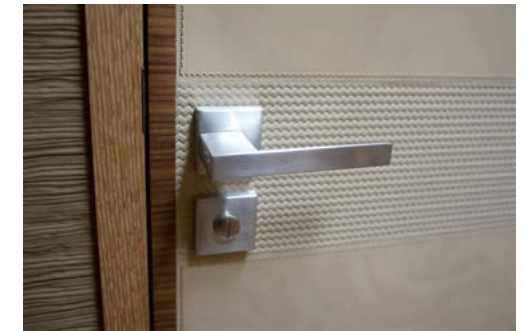
Интерьер дополнен мелкими деталями, которые можно изучать часами. Яркий пример — новое декоративное оформление массивных дверей.

брашированным дубом и светлой кожей с эффектом тертого камня. Такое обилие дубовой отделки надо было как-то смягчить, и дизайнеры верфи выбрали определенный вид орехового дерева — Noce Canaletto, применяемый в интерьерах младшей модели верфи MCY 65. Были заменены материалы угловых «ухватов» на всей мебели, выбран набор кожаной отделки главного поста управления и штурманского кресла «а-ля Bentley». Из конструктивных изменений на камбузе был урезан холодильник, что открыло взору ранее прятавшееся за ним окно и позволило красиво разместить любимую кофемашину. Материал рабочей поверхности был опять же применен, как на 86-й, — мрамор теплого цвета с разводами вместо стандартного, слегка сероватого. Компонировка и функционал нижних кухонных шкафов стали полностью отвечать требованиям В. & А. Нашлось даже место прессу для мусора, позволяющему не захламлять заполненными пакетами тендер или другие не подходящие для этого места. Кроме того, были внесены