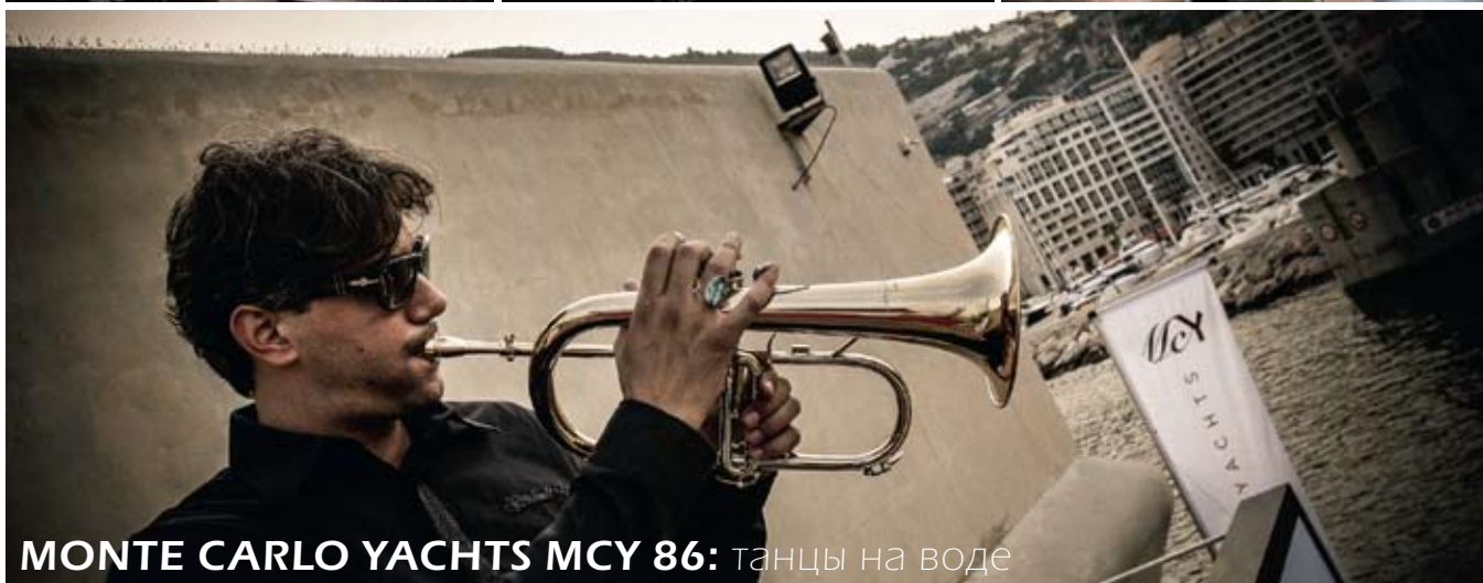
MONTE CARLO YACHTS MCY 86: танцы на воде